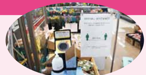
入口のアルコール消毒器