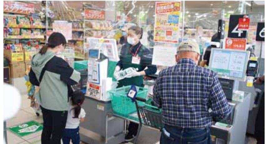
レジでのマスク着用とフィルムの設置

6月いっぱい、すべて中止いたします。（通常総代会は書面議決書による議決権の行使を推奨します）